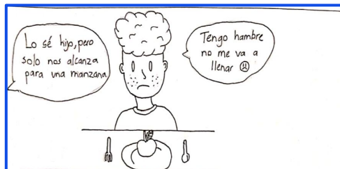
Persona en necesidad de alimentos

ESCENARIO: Economía que se desperdicia en funcionamiento.