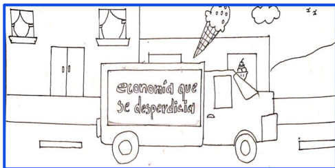
Transporte de productos a los comedores