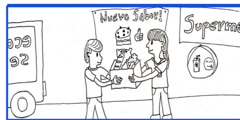
Recolección de productos en los supermercados

ESCENARIO: Economía que se desperdicia en funcionamiento.