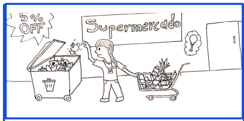
Supermercado desechando comida

PERSONA: Personas que necesitan alimentos.