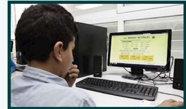
4ta Escena: Niño recibiendo clases virtuales

Lo pedagógico, trabajaría el contenido educativo de canto y arte, se le enseñaría a la comunidad tecnicas de canto, como tocar un instrumento y la importancia de las artes en nuestras comunidades resilientes.