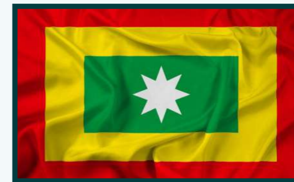
6ta Escena: Bandera de la ciudad de Barranquilla

La comunidad del barrio la luz, arranquilla y cualquier otra comunidad de América latina.