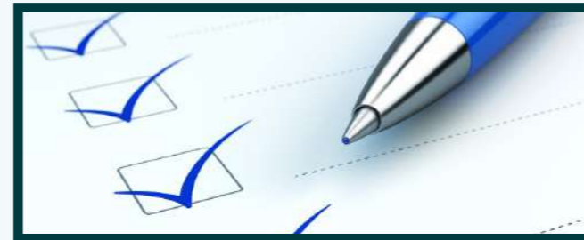
2da Escena: Lista con los actores identificados

Una vez ya identificado los actores y talleres se procede a trabajar con una metodología transversal y horizontal que permita hacer una comunidad informada, conectada y entretenida.