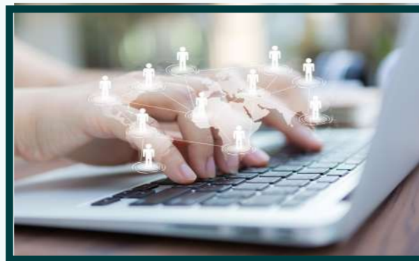
4ta Escena: Persona en un computador

Las plataforma virtuales tales como las redes sociales, facebook e instagram con apoyo del canal de youtube. conectando la comunidad del barrio la luz y otras comunidades de américa latina. Esto permitirá una comunicación bilateral e interacción permanente (acción- reacción).