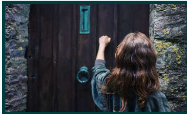
1ra Escena: Persona tocando la puerta

Iremos casa por casa, haciendo una encuesta para identificar actores, gustos de música, tipo de arte que le gustaría a la comunidad y que tipos de talleres culturales desearían aprender.